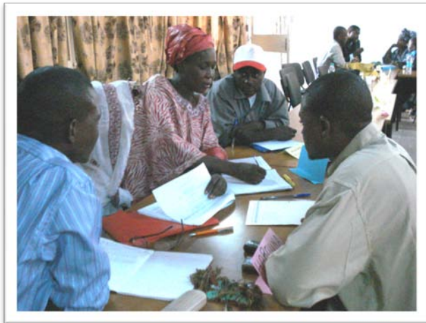
En pleine cogitation, l'équipe « public : JEUNES » lors des journées de planification 2010 – Niger, décembre 2009

Fort de cette première expérience, RPSF, de concert avec Oxfam-Québec, a pris la décision de prolonger d'un an son entente avec ce partenaire dans le but d'assurer une contribution plus durable en Afrique de l'Ouest. En 2010, RPSF accompagnera Oxfam-Québec au Niger et le Cadre de concertation dans la planification et la mise en œuvre du plan d'action annuel du Cadre.